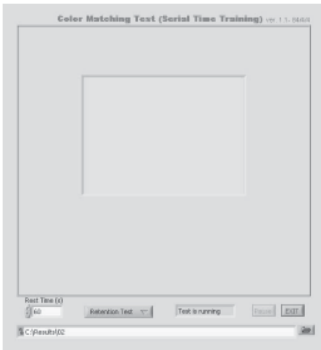
شکل ۱- نمای کلی نرم افزار CMT

در این نرم افزار هر بسته حرکتی شامل تکرار ۸ مربع می باشد که سکانس