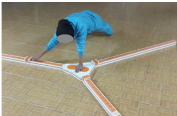
تصویر ۲. دستیابی در جهت میانی. توانبخشی