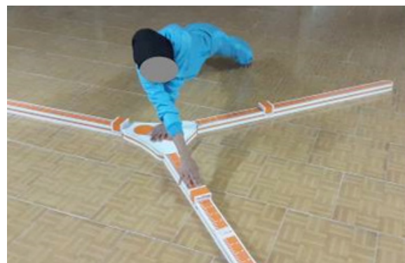
تصویر ۴. دستیابی در جهت فوقانی-جانبی. توانبخشی