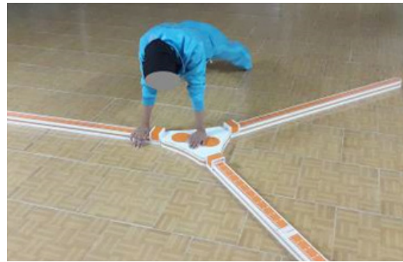
تصویر ۱. وضعیت شروع آزمون UQYBT. توانبخشی

است، درحالی که نمره ترکیبی و نمرات جهات میانی و تحتانی- جانبی سمت غیربرتر دو گروه با یکدیگر تفاوت معنی داری ندارد و تنها در جهت فوقانی-جانبی تفاوت معنی داری بین دو گروه مشاهده می شود.