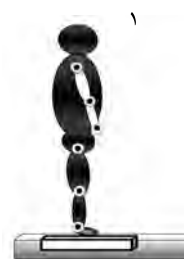
۱. وضعیت شروعی آزمون تصویر