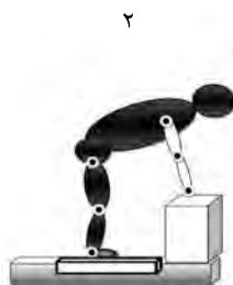
۲. حرکت در سطح ساژیتال به صورت قرینه تصویر