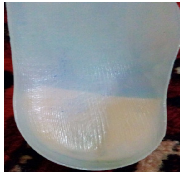
تصویر ۴. اصلاح کفی با شیوه «برداشت از بخش داخلی پاشنه».

در پاشنه توسط کولیس و خط‌کش طی مرحله قالب‌گیری و اصلاح قالب به‌عنوان نشانه تعیین شد. سپس مرحله برداشتن و صاف کردن این نقطه با زاویه ۱۵ درجه آغاز و تا عمق چهار میلی‌متری دنبال شد. همچنین برای گرد کردن اطراف این ناحیه در راستای جلوگیری از ناراحتی بیمار توجه کافی و قوس طولی داخلی حمایت شد [۲۴، ۲۵].