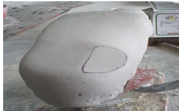
تصویر ۳. اصلاح کفی با شیوه «برداشت از بخش داخلی پاشنه».