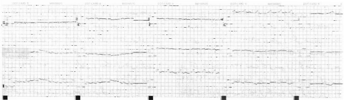
نوار قلب بیمار