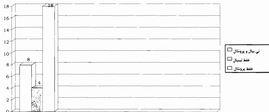
نمودار شماره ۲ - فراوانی عصب درگیر بیماران مورد مطالعه

شده است. به طور کلی، نتیجه عمل جراحی در تمام موارد موفقیت آمیز بود.